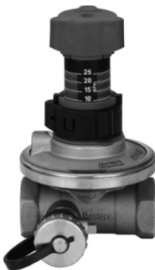
АРТ DN 15-50