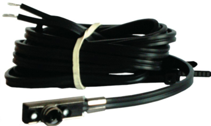
Общий вид датчика температуры типа ESMC

Датчик температуры типа ESMC, представляющий собой платиновый термометр сопротивления (1000 Ом при 0 °С), применяется для управления и индикации температуры различных поверхностей в системах отопления, охлаждения, горячего и холодного водоснабжения, вентиляции и кондиционирования.